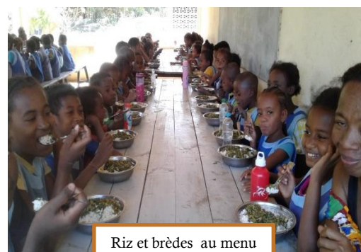
Riz et brèdes au menu