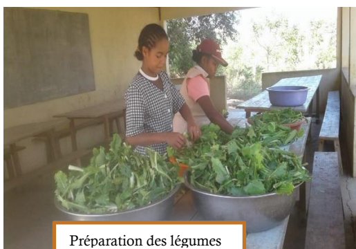
Préparation des légumes