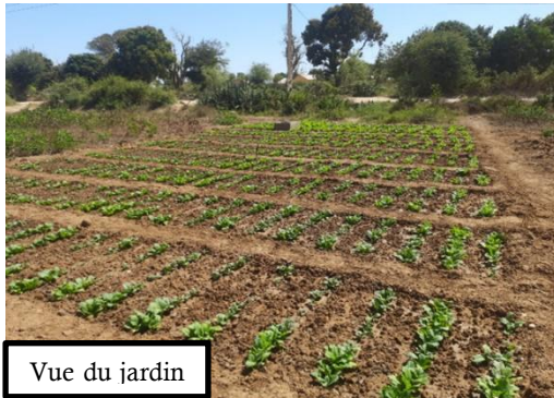
Vue du jardin