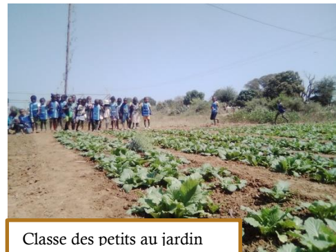
Classe des petits au jardin

Avec l'éducation, la lutte contre la faim et la malnutrition des enfants de l'école est la priorité de l'association depuis l'ouverture de la cantine scolaire en 2014.