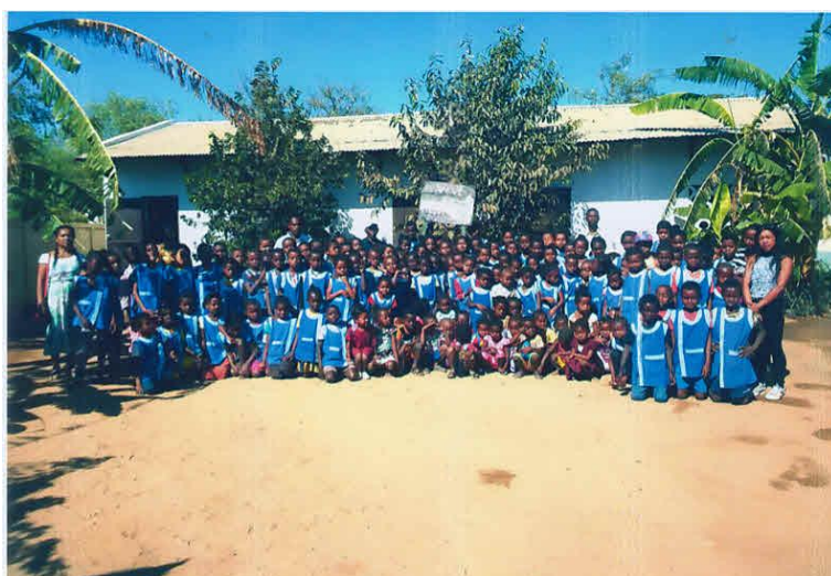
Les enfants dans leur nouvelle blouse bleue